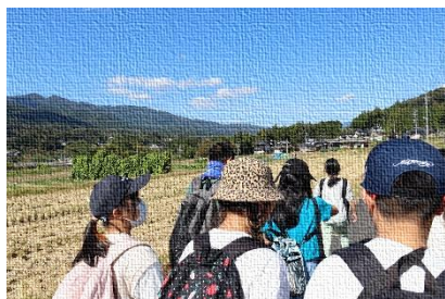
【ハイキング(知原橋へ)】

10月18日(水)・19日(木)に、5年生が1泊2日で中津川野外学習に出掛けました。子どもたちは、ハイキング・飯ごう炊さん・キャンプファイヤー・グランドゴルフ・ミニモトクロス・アスレチック・ペンダントづくりを行い、友情を深めながら自然を満喫しました。ハイキングでは、4.1キロのコースを歩く中で田園風景や付知川の美しさ、自然の壮大さを味わうことができたようです。朝晩は冷え込みが強く、名古屋とは違った山の生活を体験することができました。