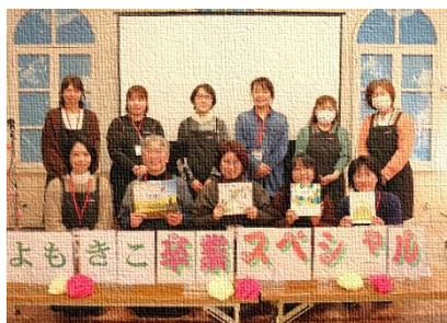
【企画と運営をしてくださいました】

それぞれの絵本は、事前にパソコンに取り込まれ、教室前方のスクリーンに投影されます。子どもたちは投影された絵本に目をやりながら、想像の翼を広げて、よもきこさんのお話に聞き入っていました。よもきこさんは絵本を読み始める前に、その絵本を選んだ理由を話してくださいます。子どもたちは、よもきこさんの温かいお気持ちに「卒業」という二文字を重ねながら、絵本の世界に浸っていました。